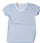
⑪ 肌着又は半袖シャツ